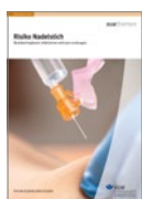
Risiko Nadelstich – Infektionen wirksam vorbeugen (BGW 09-20-001)

• Stellen Sie Ihren Mitarbeiterinnen und Mitarbeitern nur „sichere Instrumente“ zur Verfügung. Unterweisen und trainieren Sie Ihre Beschäftigten im Umgang mit diesen Instrumenten. Informationen finden Sie in der BGW-Broschüre „Risiko Nadelstich“. • Wirken Sie bei den hausärztlichen Praxen Ihrer Pflegekundinnen und -kunden auf die Verschreibung „sicherer Instrumente“ hin. • Stellen Sie für die Entsorgung von Kanülen – auch von „sicheren Instrumenten“ – und anderen spitzen Gegenständen flüssigkeitsdichte, stich- und bruchfeste Abwurfbehälter („Kanülensammler“) zur Verfügung.