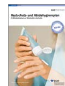
Hautschutz- und Händehygieneplan für Mitarbeiterinnen und Mitarbeiter in der Küche (Bestellnummer: BGW 06-13-070)