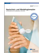
Hautschutz- und Händehygieneplan für Mitarbeiterinnen und Mitarbeiter in der Küche (Bestellnummer: BGW 06-13-070)