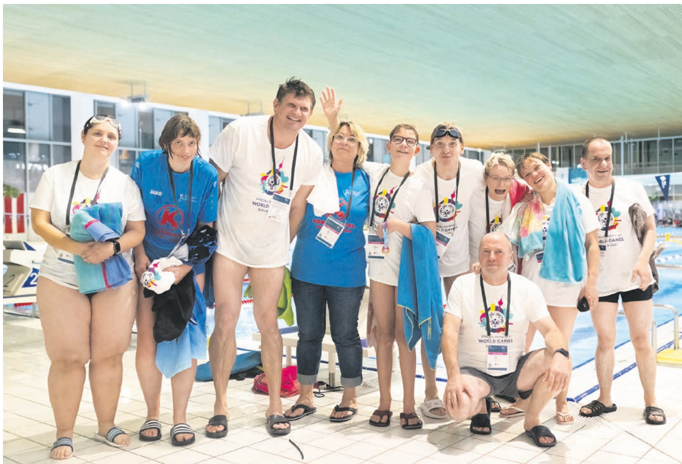
Vom Startblock, Beckenrand – oder anders. Das deutsche Schwimm-Team freut sich auf Berliner Wasser.