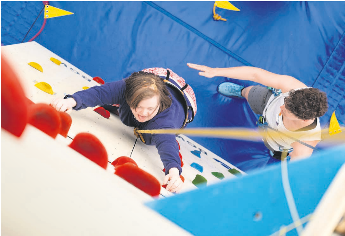
Alles im Griff. Der Kletterturm soll gleichberechtigte Teilhabe ermöglichen.