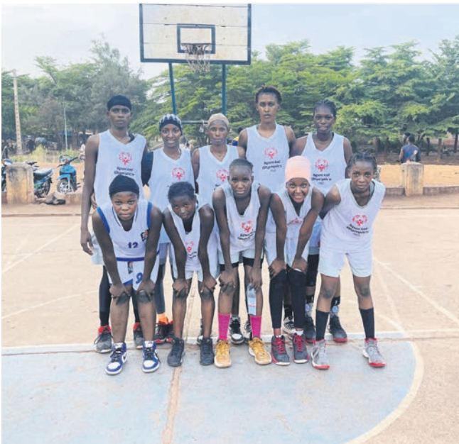
Die Delegation von Mali mit seinen Basketballerinnen gastiert vor ihrer Reise nach Berlin im Landkreis Augsburg.