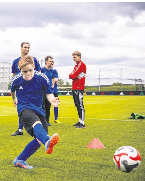
55 Fußballer bilden bei den Weltspielen insgesamt fünf deutsche Nationalmannschaften.

ler*innen zu den Spielen, darunter Spieler für zwei Unified-Teams der Männer. Solche inklusiven Mannschaften starten für Deutschland noch im Badminton, Basketball, Beachvolleyball, Boccia, Bowling, Futsal, Handball, Kanu, Segeln, Tennis und Tischtennis.