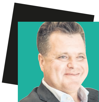
Jürgen Dusel Beauftragter der Bundesregierung für die Belange von Menschen mit Behinderungen

Jetzt freue ich mich erst einmal auf dieses großartige Sportereignis und kann nur allen empfehlen hinzugehen und sich selbst von dieser besonderen Stimmung zu überzeugen.