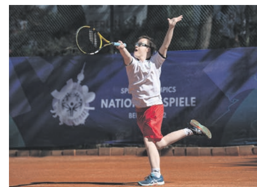
Kegeln, Quiz – und Training. Bei den Tennisspielern steht der Spaß und Teamgedanke im Vordergrund.

Wermelskirchen und ihre Mannschaftskolleg*innen bilden die größte Abteilung der deutschen Delegation. Insgesamt fahren 55 Fußball-