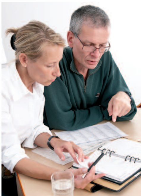
Beim Eingliederungsmanagement kommt es auf den individuellen Fall und das persönliche Gespräch an

Die BGW hat einen Praxisleitfaden zum Betrieblichen Eingliederungsmanagement für Pflegeeinrichtungen veröffentlicht, der auch für andere Unternehmen interessant und nützlich ist. Er kann von der Internetseite der BGW heruntergeladen werden: www.bgw-online.de → Suchworte „Praxisleitfaden BEM“ eingeben