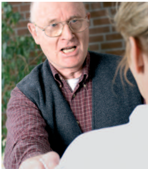
Gewalt gegen Pflegekräfte ist kein Ausnahmefall

Aggressives Verhalten ist oft durch den gesundheitlichen Zustand oder die