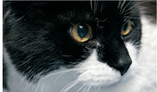
Stubentiger können mit ihren Bissen gefährliche Infektionen verursachen

Die BGW, als gesetzliche Unfallversicherung für Tierärzte und ihre Angestellten mit der Thematik vertraut, rät daher: Wer von einer Katze gebissen wird, sollte die Wunde sofort reinigen und desinfizieren. Ist trotzdem nach einer Weile eine Schwellung und Rötung zu beobachten und setzen Schmerzen sowie das typische Pochen ein, sollte man spätestens dann einen Arzt oder die Notaufnahme eines Krankenhauses aufsuchen. Tierärzte und ihre An-